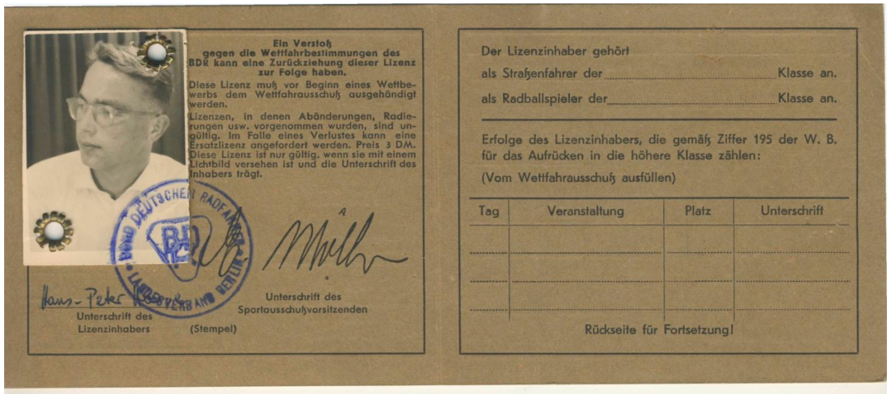
Meine erste Amateur-Lizenz ausgestellt vom BDR – Landesverband Berlin